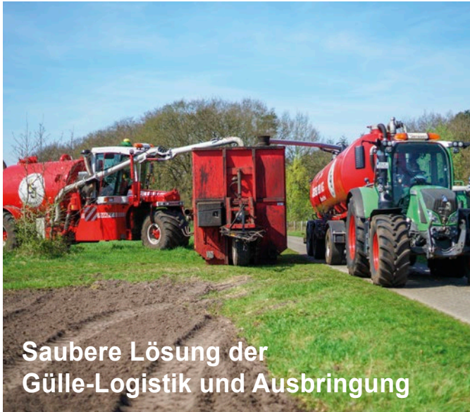
Saubere Lösung der Gülle-Logistik und Ausbringung